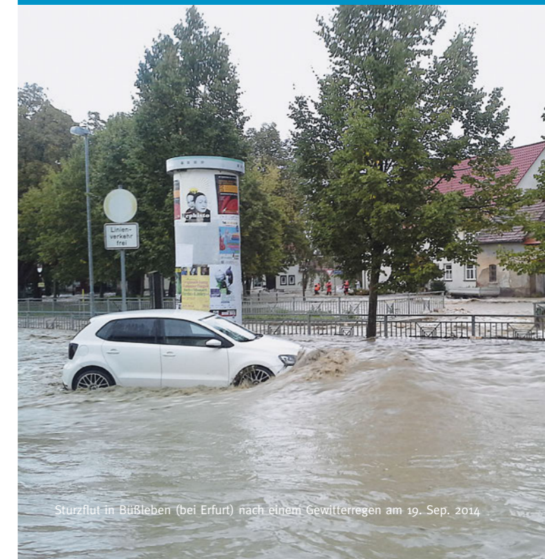
Sturzflut in Büßleben (bei Erfurt) nach einem Gewitterregen am 19. Sep. 2014