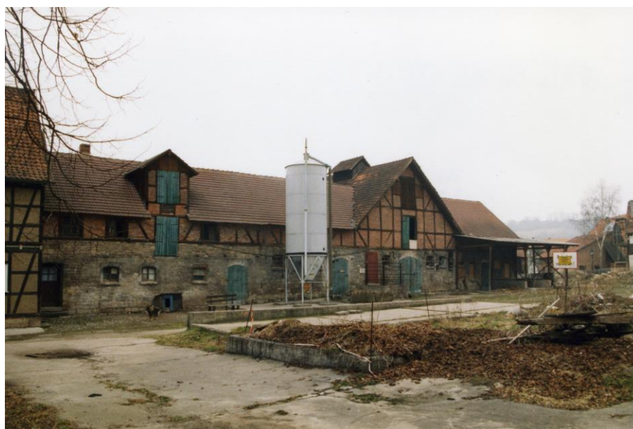
(Alle Angaben ohne Gewähr)