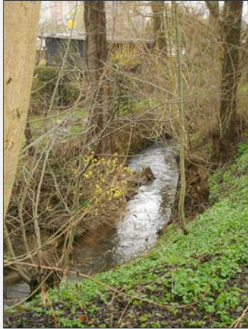
Umsetzung Im Zuge der Unterhaltung