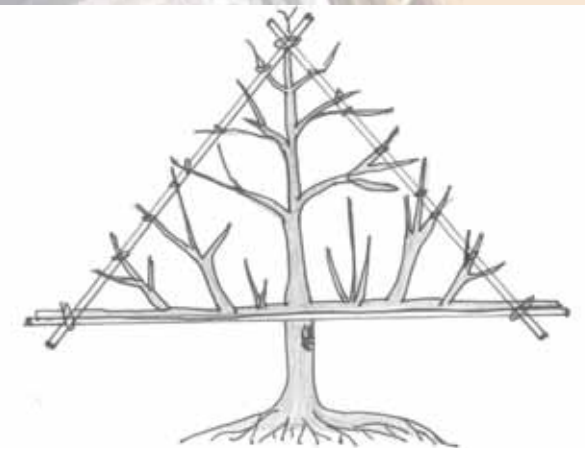
Aprikose und Pfirsich am Spalier