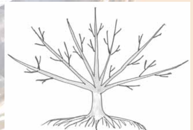
Fächerspazier für Pflaume, Aprikose oder Pfirsich