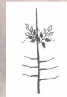
Pinzieren eines Baumes im oberen Kronenbereich