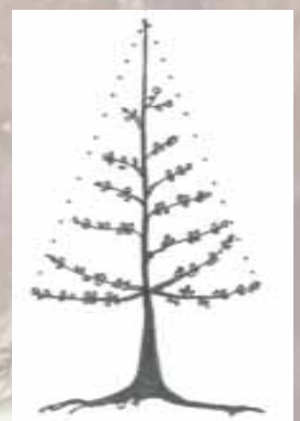
Sicherung eines pyramidalen Baumaufbaus