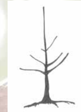
Pflanzung eines Baumes auf schwacher Unterlage