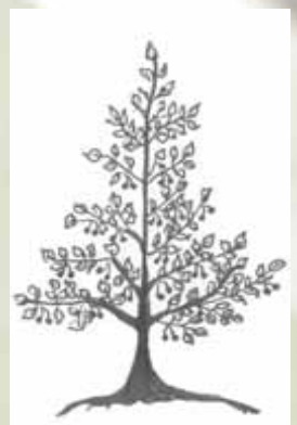
Frühzeitiger Ertrageintritt, gute Erntbarkeit