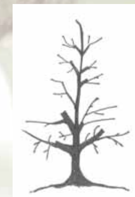
Entfernung zu starker Seitenäste auf langen Zapfen