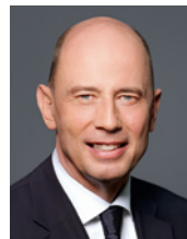
Wolfgang Tiefensee Minister für Wirtschaft, Wissenschaft und Digitale Gesellschaft des Freistaats Thüringen

wurde nötig, weil wir in dynamischen Zeiten leben. Die Rahmenbedingungen der Wirtschafts- und Forschungsförderung ändern sich ebenso wie die Herausforderungen, vor denen Unternehmen und Forschungseinrichtungen stehen. Darauf muss moderne Politik reagieren und ihr Förderinstrumentarium ständig neu justieren. In diesem Band finden Sie bewährte Programme und Neukonzeptionen, die auf die wichtigsten Herausforderungen unserer Zeit zugeschnitten sind. Dazu gehört die Frage, wie es den Thüringer Unternehmen gelingen kann, von der Digitalisierung zu profitieren. Dazu gehört aber auch die Frage, welchen Einfluss die sinkende Verfügbarkeit von Arbeitskräften auf die Förderpolitik haben muss.