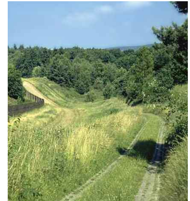
GRÜNES BAND an der Gedenkstätte Schiffersgrund bei Asbach-Sickenberg, Eichsfeldkreis

Durch die Naturlandschaften Thüringens verlaufen 763 eindrucksvolle und erlebnisreiche Kilometer. Das Grüne Band nimmt hier eine Fläche von 6.580 ha ein. Es ist auch in Thüringen ein bedeutendes Rückzugsgebiet. Fast 20 Prozent der Flächen besitzen einen hohen Schutzstatus, allein 40 Naturschutzgebiete schließen 1.300 ha des Grünen Bandes ein. Hinzu kommen 2.455 ha Natura 2000-Flächen (EU Flora/Fauna/Habitat- und Vogelschutzgebiete) und 19 ha Flächennaturdenkmale. Das Grüne Band verläuft über 114 km im Biosphärenreservat Rhön.