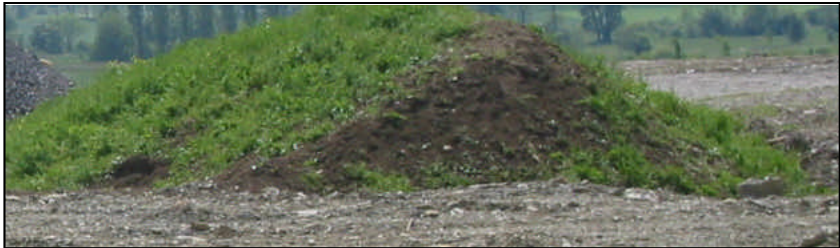
Humoses Bodenmaterial ist besonders geeignet

Nicht jedes Bodenmaterial ist für die Aufbringung geeignet. Grundsätzlich sind bestimmte chemische, physikalische und umwelthygienische Anforderungen zu erfüllen.