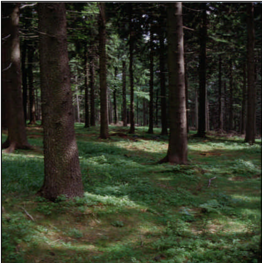
Waldböden sind von Bodenauffüllungen ausgeschlossen