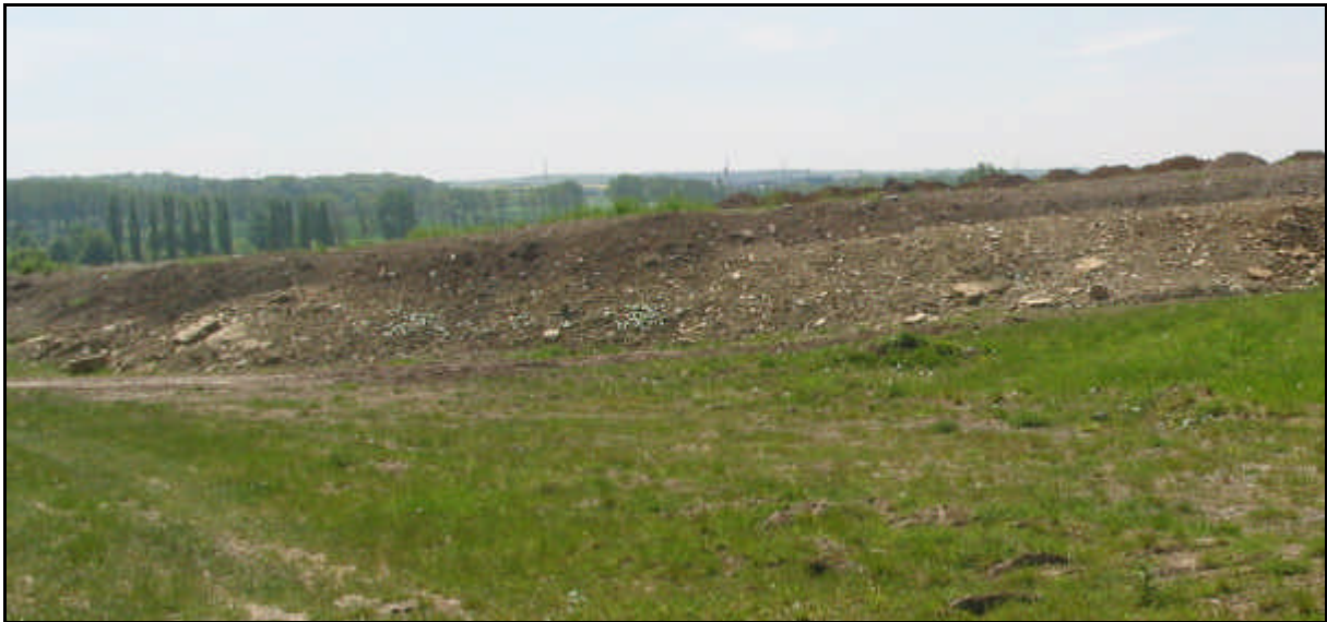
Einsatz von Bodenmaterial im Landschaftsbau - Geländeanpassung

bei denen Materialien auf und in eine vorhandene durchwurzelbare Bodenschicht oder zur Herstellung einer durchwurzelbaren Bodenschicht aufgebracht werden.