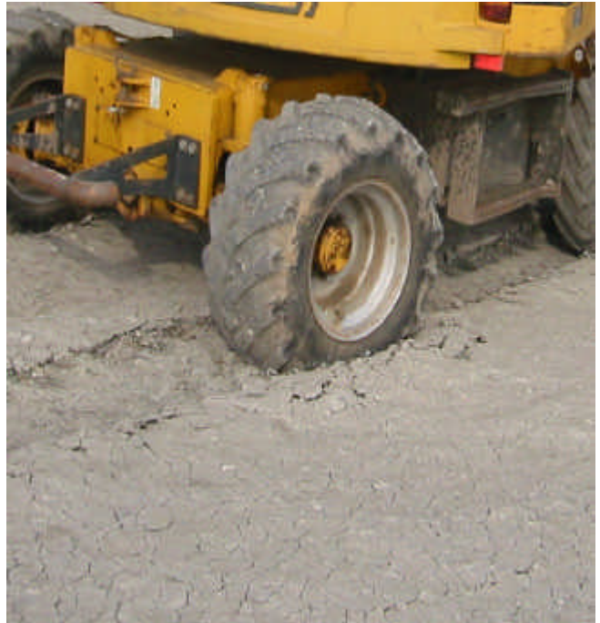
Verdichtung - eine Folge häufiger Befahrungen