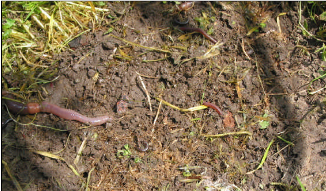
Böden als Lebensgrundlage zahlreicher Organismen

Böden sind unsere Lebensgrundlage und erfüllen vielfältige Funktionen. Intakte Böden sind beispielsweise Voraussetzung für sauberes Trinkwasser und gesunde Nahrungsmittel. Bodenmaterial oder andere Materialien werden zur Bodenverbesserung oder Erhaltung der Leistungsfähigkeit der Böden aufgebracht. Bei unsachgemäßer Aufbringung von Materialien können Böden aber auch irreversibel geschädigt oder gar zerstört werden.