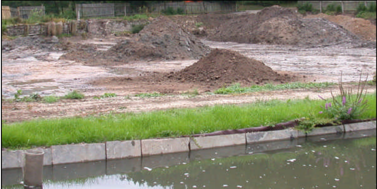
Baggergut - Entschlammung eines verlandeten Teiches

In Thüringen fallen jährlich große Mengen an Bodenaushub, Baggergut, Klärschlamm und Bioabfall an, die bei entsprechender Eignung zu verwerten sind.