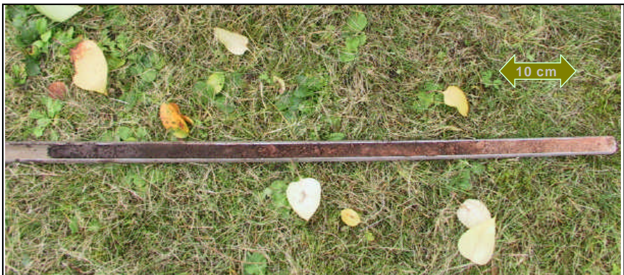
Ermittlung der Untergrundbeschaffenheit mittels Pürckhauer-Bohrstock

Bei der Bestimmung der physikalischen Beschaffenheit des Bodens können bereits vorhandene Unterlagen (Bodenkarten, Baugrundgutachten etc.), Analysenergebnisse und einfache Prüfmethode im Gelände helfen.