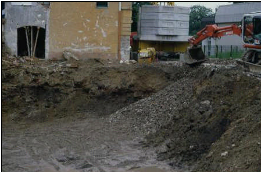
Aushub von Bodenmaterial

Beim Ausbau von Bodenmaterial ist zu beachten, dass Ober- und Unterboden sowie Bodenschichten unterschiedlicher Verwertungseignung getrennt ausgebaut und verwendet werden. Bestehender Pflanzenwuchs sollte zuvor entfernt werden.