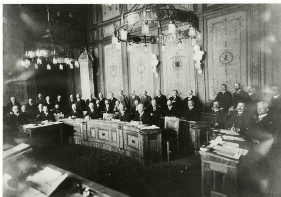
Plenarsaal des Volksrates von Thüringen im Weimarer Fürstenhaus

Zu diesem Zweck hatten sich die Landtagspräsidenten und Regierungsvertreter von Sachsen-Weimar-Eisenach, Sachsen-Meiningen, Sachsen-Altenburg, Sachsen-Gotha, Sachsen-Coburg, Schwarzburg-Rudolstadt, Schwarzburg-Sondershausen und Reuß bereits am 20. Mai 1919 auf die Bildung einer Staatengemeinschaft festgelegt, welche die gänzliche Verschmelzung der beteiligten Einzelstaaten vorbereiten sollte. Die Gemeinschaft, der insgesamt weitreichende Rechte übertragen wurden, war u. a. ermächtigt zur Regelung sämtlicher Gebiete der Gesetzgebung und Verwaltung für die Einzelstaaten und unterhielt mit dem Volksrat sowie dem Staatsrat eigene Organe.