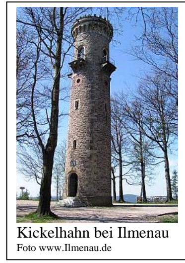
Kickelhahn bei Ilmenau