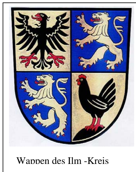
Wappen des Ilm -Kreis

Herzlich willkommen auf den Schulsportseiten des Ilm - Kreises