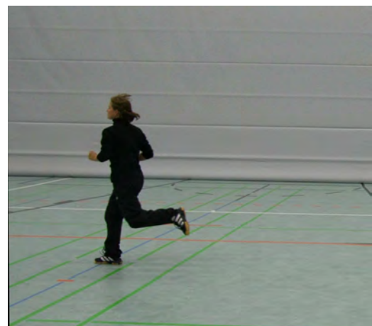
Bild 5: Beim 10. Mal muss nicht berührt, sondern nur überlaufen werden