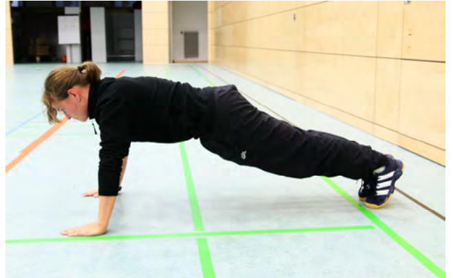
Bild 1 und 2: Der Teilnehmer kann wählen, ob er die Füße an der Wand oder frei im Raum abstellen möchte.