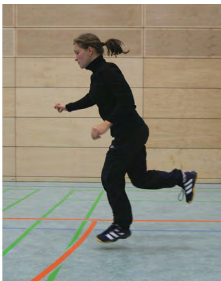
Bild 4: Landung nach zweitem Sprung (gleiches Bein wie bei erstem Sprung).