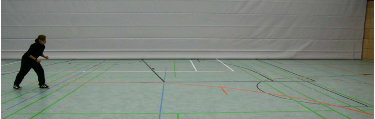
Bild 1: Startposition, die blaue Linie links und rechts außen haben 9m Abstand.

Zwischen zwei Linien im Abstand von 9 m (Volleyballfeld) läuft die Testperson von links nach rechts so schnell wie möglich. Dabei berührt sie die Linien mit der äußeren Hand. Beim 10. Mal braucht die Linie nicht mehr berührt zu werden. Gemessen wird die Zeit vom Kommando „Los!“ bis zur 10. Wiederholung. Jeder Teilnehmer hat grundsätzlich einen Versuch.