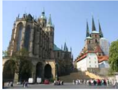
Dom und Severi-Kirche

Das abwechslungsreiche studentische Leben wird durch die Erfurter Universität, an der schon Luther studierte, bereichert. Die historische Altstadt, größtes Flächendenkmal Deutschlands, ist durch die über 1250-jährige Geschichte der thüringer Landeshauptstadt geprägt.