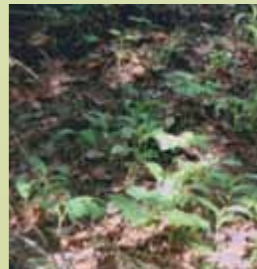
Schwachwüchsige, nicht blühfähige Pflanzen an einem zu schattigen Standort