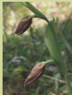
Im Licht knospender Frauenschuhe, unterstützt durch eine fachgerechte Waldbewirtschaftung