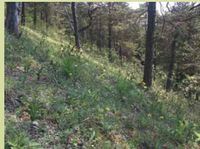
Halbschattige, lockere Bestockung - für den Frauenschuh die optimale Biotopstruktur

Viele der derzeit noch in Thüringen vorhandenen Vorkommen leiden sehr an einer zu starken Beschattung durch Waldbäume und -sträucher. Auch Verfilzung in der Krautschicht hat kümmerwachstum und ungenügende Keimmöglichkeit des Samens zur Folge. Hier kann konkret geholfen werden. Als günstig für das Wachstum und die Blüte der Pflanzen hat sich ein lichtiges Kronendach (Überschirmungsgrad nicht über 60-70%) erwiesen. Eingriffe in den Gehölzbestand (v.a. Sträucher, Jungwuchs) sollten im Juli / August erfolgen, weil in diesem Zeitraum einerseits die Frauenschuhpflanzen noch zu erkennen sind, andererseits die Bildung des neuen Triebes für die nächste Wachstumsperiode bereits weitgehend abgeschlossen ist. Diese Arbeiten müssen in jedem Fall aber durch eingewiesenes Personal erfolgen, so dass die Wuchsorte geschont und Beeinträchtigungen der Pflanzen weitgehend vermieden werden.