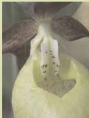
Blick in die Kesselfalle (Schuh)

felförmigen Kessels streifen sie in der nächsten Blüte beim gleichen Vorgang an der klebrigen Narbe angeheftet werden. Die Bestäubung erfolgt v. a. durch Sandbienen ( Andrena spp. ) und weitere kleine, kräftige Insekten. Diese erdbewohnenden Insekten benötigen schütter bewachsene Rohbodenbereiche (Sand, sandiger Lehm, Schluff) in max. 500 m zum nächsten Frauenschuhvorkommen.