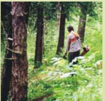
Biotoppflege mittels Freischneider

Für den Erfolg der Pflegemaßnahme ist es wichtig, die Strauchschicht nicht außer Acht zu lassen. Je nach Ausschlagsvermögen können mehrere sich wiederholende Eingriffe in die Strauchschicht notwendig sein.