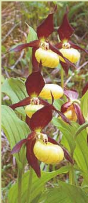
Blütenstand des Frauenschuhs ( Cypripedium calceolus )

Eine der attraktivsten Blütenpflanzen Thüringens ist zweifellos der Frauenschuh ( Cypripedium calceolus ).