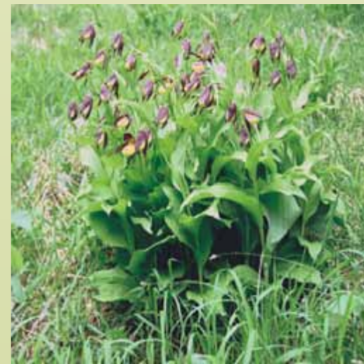
Leider zunehmend ein seltener Anblick: Aufblühender Frauenschuhhorst am optimalen Standort

Leider sind die Frauenschuhvorkommen vielerorts verschwunden. An etlichen verbliebenen Wuchsorten sind die Bestände zahlenmäßig stark zurückgegangen. Daher gilt in Deutschland und in vielen anderen europäischen Ländern diese Art als gefährdet oder stark gefährdet.