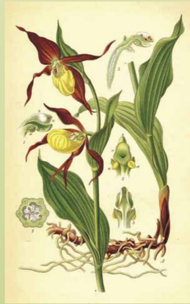
Chromotafel aus SCHULZE (1894)