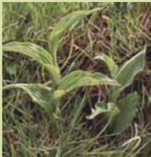
Frauenschuh im nicht blühenden Zustand

Im blühenden Zustand ist der Frauenschuh wohl mit keiner anderen Pflanze zu verwechseln, zu typisch sind doch seine Blüten mit dem auffälligen zitronengelben „Schuh“. Sie erscheinen meist allein, manchmal aber auch zu zweit oder dritt an einem bis zu 70 cm hoch reichenden, mit 2 - 4 Blättern versehenen Stängel. Schwieriger ist das Erkennen nicht blühender Pflanzen, obwohl die frisch grünen, bis zu 18 cm langen breitelliptischen, zugespitzten Blätter recht typisch sind. Sie weisen deutlich hervortretende Blattnerve auf und sind auf der Blattunterseite weich behaart.