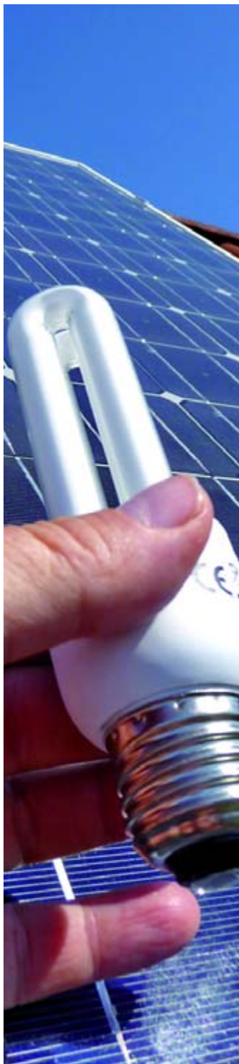
Energie einsparen