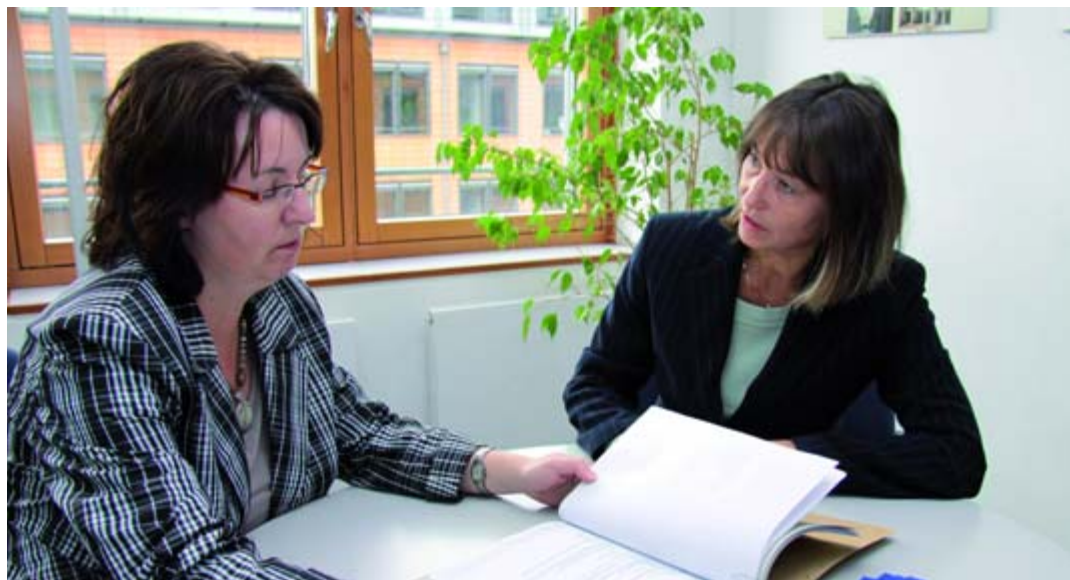
Das Engagement der Berater sichert den Erfolg der Thüringer Unternehmen

ringer Aufbaubank auf die bewährte Zusammenarbeit mit in Thüringen ansässigen Banken und Sparkassen - sie werden als Refinanzierungsdarlehen über die Hausbanken gewährt. Freistaat und Banken teilen sich so