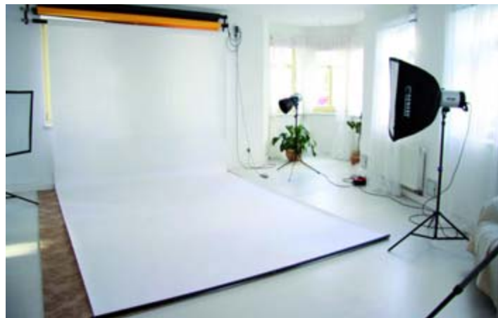
Aufnahmen für die Ewigkeit - das Studio bietet viele Möglichkeiten.