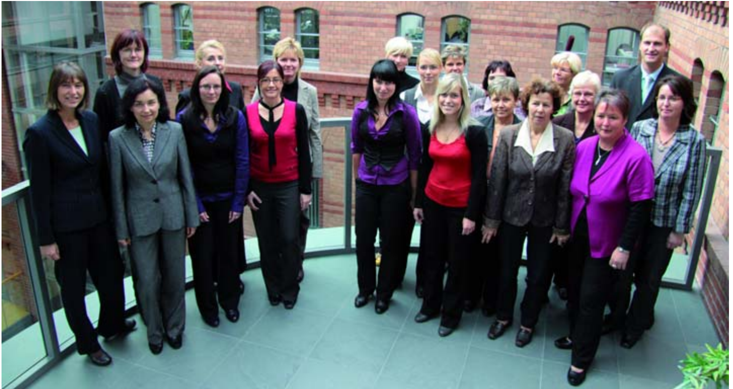
Das TAB-Team der Abteilungen Thüringen-Invest/ Landesinvestitionsprogramm (LIP) sowie Programmkredite