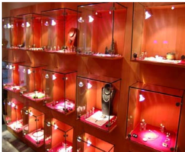
Auswahl für den besonderen Geschmack.

Ja, natürlich. Ich habe noch immer viel zu wenig Zeit für meine Kinder. Aber die tragen es zum Glück mit Fassung.