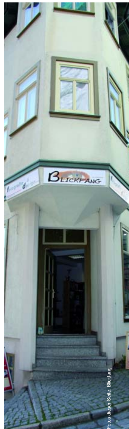
Das Geschäft in Arnstadt.