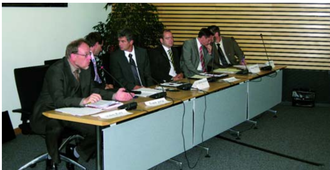
Gute Planung für Einheitliche Ansprechpartner: Im Landtag wurde die Richtlinie über Dienstleistungen im Binnenmarkt beraten.

gaben der IHK Erfurt agieren sie als neutraler Verfahrenspartner für Unternehmen und Verwaltung und verfügen über Kompetenzen, um Unternehmen fundiert informieren und beraten zu können. Diese Erfahrungen resultieren auch daraus, dass die Kammern Ansprechpartner für Unternehmen bei Gründung, Wachstum, Sicherung und Nachfolge sind und darüber hinaus über eine flächendeckende Präsenz verfügen. Gerade für exportorientierte Unternehmen sind Fremdsprachenkompetenz und Erfahrungen im Umgang mit ausländischen Unternehmen seit vielen Jahren eine große Hilfe.