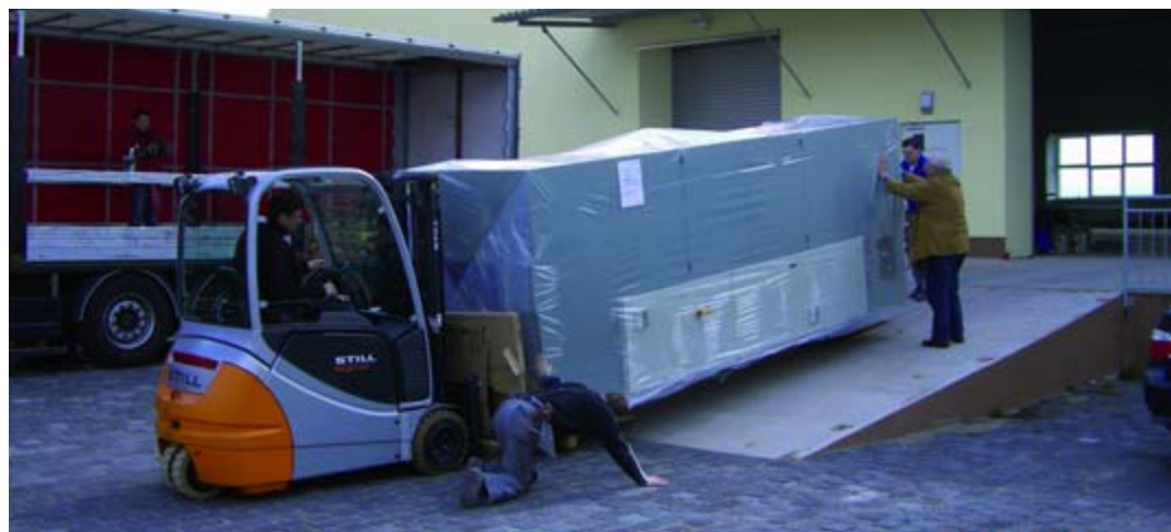
Nachschub für die Produktion: 75 t Aluminium hat das Unternehmen in den ersten neun Monaten verarbeitet.

mann, weil die Idee familiär mitgetragen wurde. Die Aluelements GmbH ist ein Familienunternehmen. Siegm