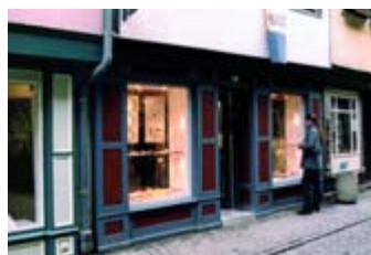
Das Geschäft auf der Krämerbrücke.

ellen Umsetzung meiner Ideen. Ich möchte abseits des Tagesgeschäfts mehr künstlerisch arbeiten, freier umsetzen, experimenteller denken und fächerübergreifend, beispielsweise