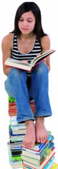
Buch lesen