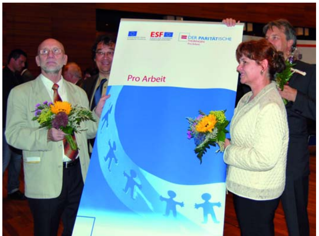
Vor zwei Jahren begann das Projekt „Pro Arbeit“

„Die Teilnehmerinnen und Teilnehmer im Projekt sind größ-