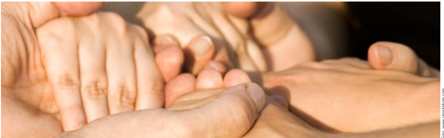
Helpende Hände sind in der Sozialwirtschaft gefragter denn je – bis 2020 werden rund 43.000 Fachkräfte benötigt.

In der Gesundheits- und Sozialwirtschaft gibt es bis 2020 einen Bedarf von rund 43.000 Fachkräften. Das belegt eine Studie der FSU Jena im Auftrag des Wirtschaftsministeriums. Dieser Bereich muss sich neben der sinkenden Zahl von Ehrenamtlichen und Zivildienstleistenden zudem mit einem Imageproblem auseinandersetzen. Eine Tagung der Friedrich Ebert Stiftung zeigte Chancen und Risiken auf. Die Arbeitsbedingungen und die Entlohnung sind derzeit Gründe für mangelnde Interessenten.