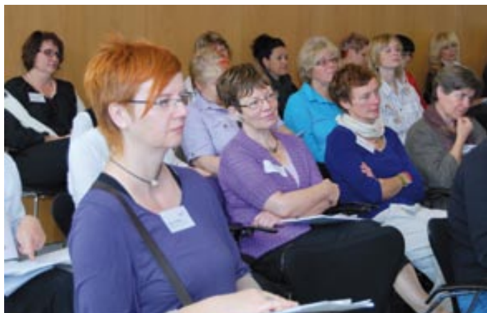
Das CORA-Netzwerk wird bis Dezember 2011 aus ESF-Mitteln finanziert. Das Ziel der Teilnehmenden am CORA-Bergfest: nicht-prekäre Beschäftigungen für Frauen

Vertretern der Arbeitsagentur, der ARGE und von verschiedenen Trägern von Projekten im Bereich haushaltsnaher Dienstleistungen und Existenzgründung wurden anhand von Praxisbeispielen erklärt, wie Beschäftigungsinitiativen in diesem Bereich gut funktionieren können. Bereits heute existiere schon ein wirklicher Bedarf an diesen Dienstleistungen, bislang sei es jedoch nicht gelungen, daraus flächendeckend existenzsichernde Beschäftigungen oder Gründungen zu generieren. Daher bleibe die Aufwertung solcher Dienstleistungen ein großes Ziel auf dem Weg hin zu nicht-prekären Beschäftigungen und anerkannter Professionalität in diesem Tätigkeitsfeld, so die CORA-AKTEURE. Das CORA-Netzwerk wird bis Dezember 2011 aus dem Europäischen Sozialfonds finanziert.