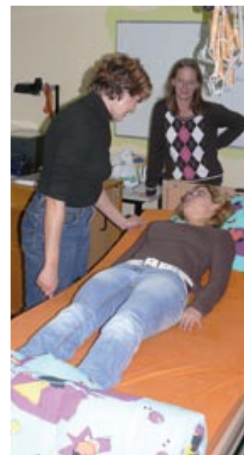
Die Ausbildung wird praxisnah von erfahrenen Pflegekräften geleitet.

te nach dem Praktikum sofort in eine Anstellung vermittelt. „Mit diesen Jobs fallen sie aus dem ALG II-Bezug raus und sind auch keine Aufstocker“, sagt Reiner Sippel von der Ziola GmbH und hofft, dass dieses Mal möglicherweise die Vermittlungsquote noch übertroffen