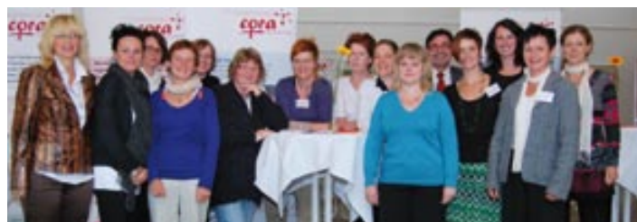
CORA: Im Netzwerk gemeinsam erfolgreich für Berufsperspektiven von Frauen.

Eine tragende Rolle im Projekt spielen die haushaltsnahen und familiennahen Dienstleistungen. Diese wirkten in doppelter Hinsicht, erklärt Müller. Zum einen entlasteten diese die Frauen selbst und zum anderen bietet dieser Bereich Beschäftigungs-