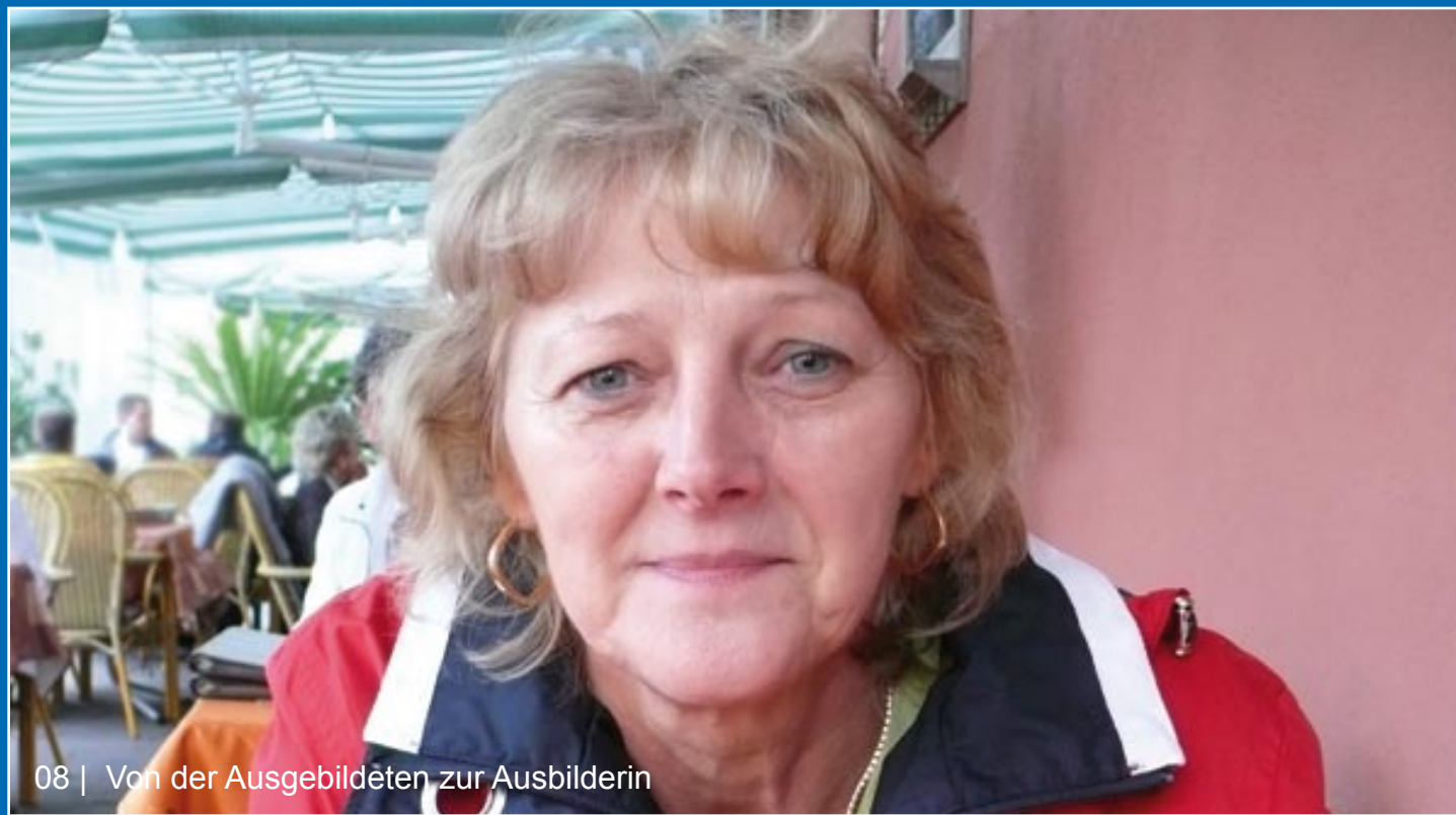
08 | Von der Ausgebildeten zur Ausbilderin