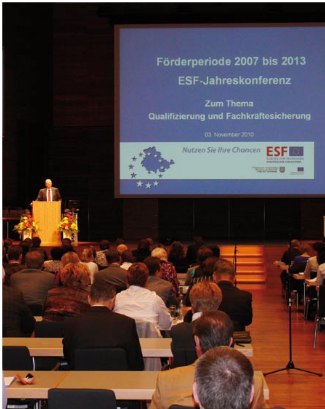
Eine gute Bilanz, eine europäische Strategie, Workshops und die aktuelle Fachkräftestudie – zur ESF-Jahreskonferenz kamen 400 Gäste.

Die Studie zeigt allerdings auch: Zumindest rechnerisch gibt es noch ein ausreichend