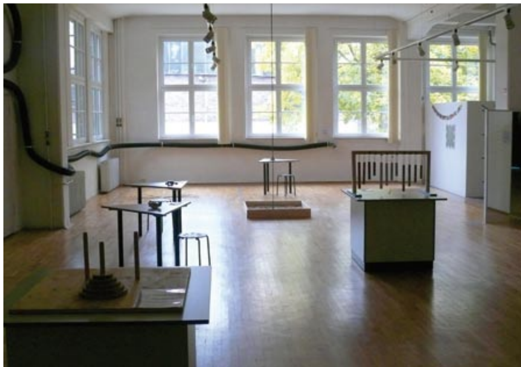
Schauen, staunen, ausprobieren - in der Ferienzeit sind die Ausstellungsräume von Explorata mit jungen Naturforschern gefüllt.

Erst arbeitete sie an der Kasse und als Reinigungskraft, Ende 2004 leitete sie den Ausstellungsbetrieb. Doch die Schau wurde geschlossen. 2006 musste sie sich arbeitslos melden und hatte nach eigenen Angaben „viel Glück mit meiner Fünf-Sterne-Fallmanagerin“. Sie begann eine Ausbildung zur Kauffrau im Gesundheitswesen, wechselte dann in eine Ausbildung im Industriekaufbereich. „Damals habe ich gedacht, ich könnte mich mit diesem Wissen selbständig machen, nach der Ausbildung habe ich gedacht, ich müsste