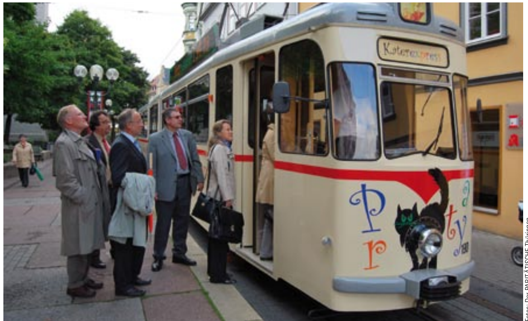
Auf Schienen zum nächsten ESF-Projekt unterwegs - die Tourteilnehmer erkundeten Beispiele für die Förderpraxis in Erfurt

Im Rahmen der Tour wurden verschiedene Projektstandorte angefahren. Hierzu zählte das European Career Center Er-